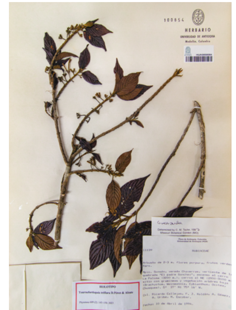
Desde 1994, a la ficha de este espécimen se le agregó una anotación con su nueva clasificación.