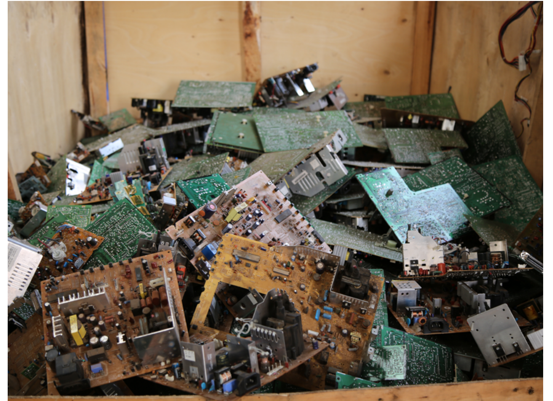
Las prácticas de obsolescencia programada limitan la vida útil de los dispositivos electrónicos. Es necesario buscar soluciones para proteger los recursos del planeta.