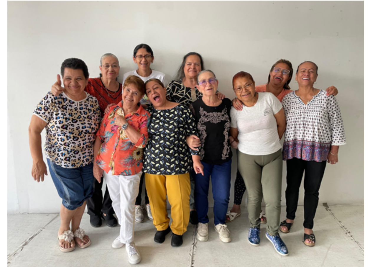
Madres de la Candelaria participantes del proyecto «Expresiones teatrales de las Madres de la Candelaria: creación de espacios político-poéticos de paz».