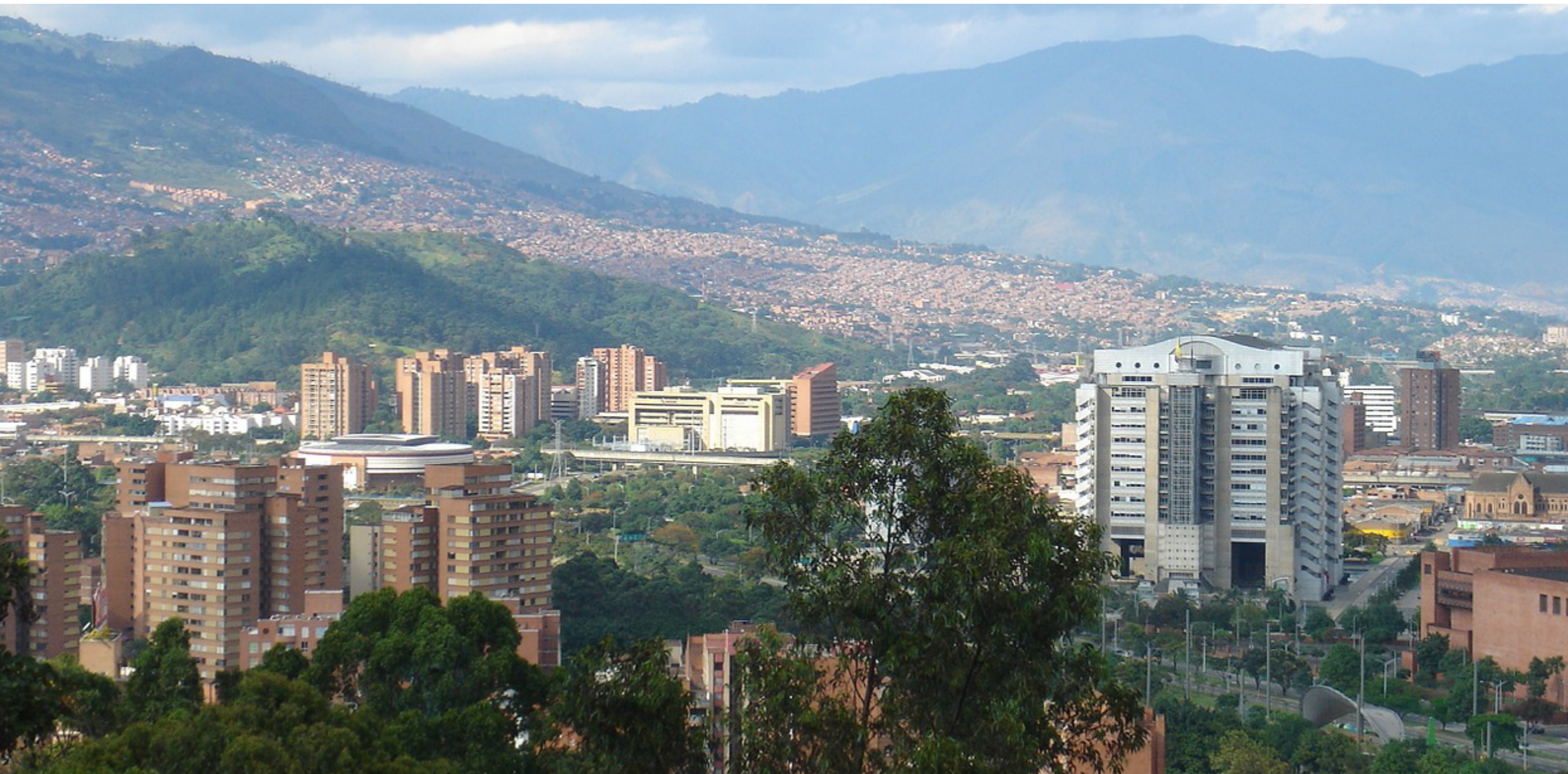
La Agenda Ciudadana 2023 ya está circulando en las campañas de los candidatos a la Alcaldía y al Concejo de Medellín.