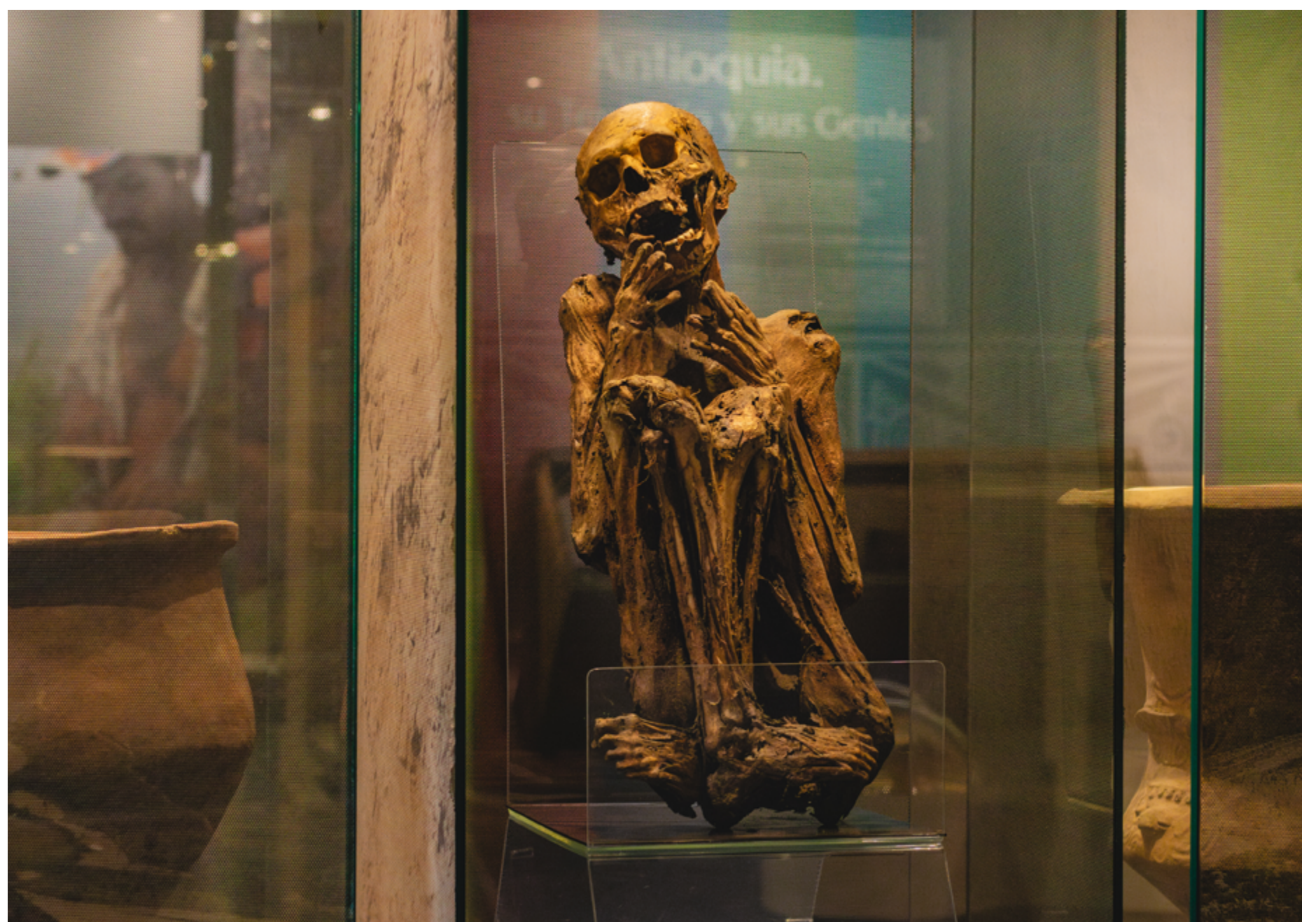
Una de las momias se encuentra exhibida ahora en el Museo Universitario de la Universidad de Antioquia.