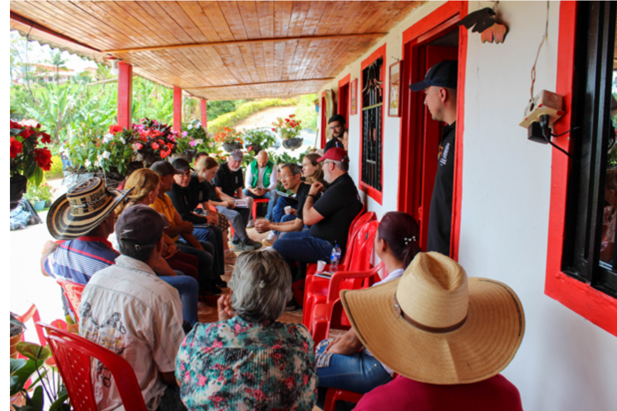
En una finca de Angostura, John O'Keefe y su equipo visitaron, a finales de agosto, a familias de pacientes que tienen un tipo de alzhéimer estudiado por el Grupo de Neurociencias de Antioquia.

John O'Keefe se interesó por el trabajo del GNA y luego de varias reuniones y de planeación, en agosto anunciaron una