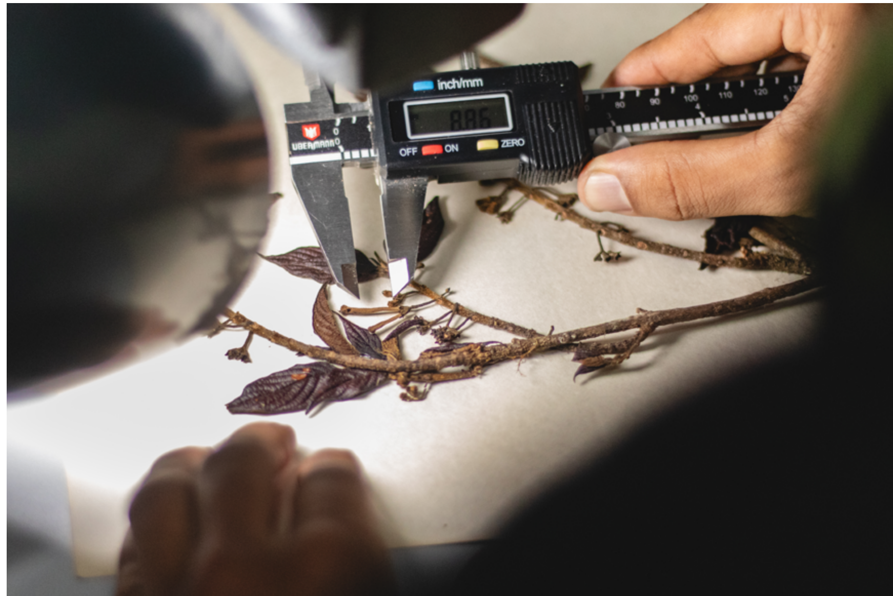
Este es el único ejemplar de Tournefortiopsis triflora que se ha encontrado hasta ahora y está en el Herbario.