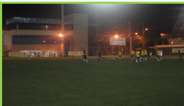
El equipo campeón fue el de la IPS Universitaria y el subcampeón fue el equipo de egresados A, conformado por egresados jóvenes