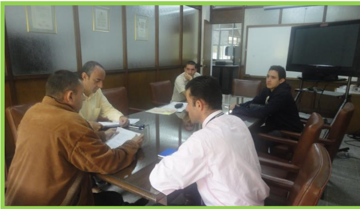
Reunión de congreso Técnico