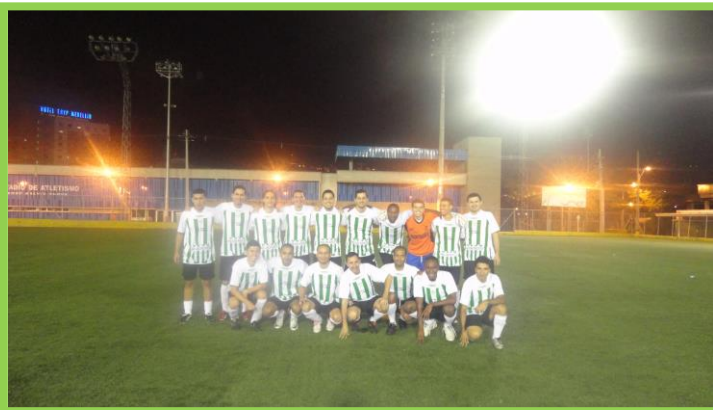
La copa se realizó en las instalaciones de la cancha Marte de la Unidad deportiva Atanasio Girardot