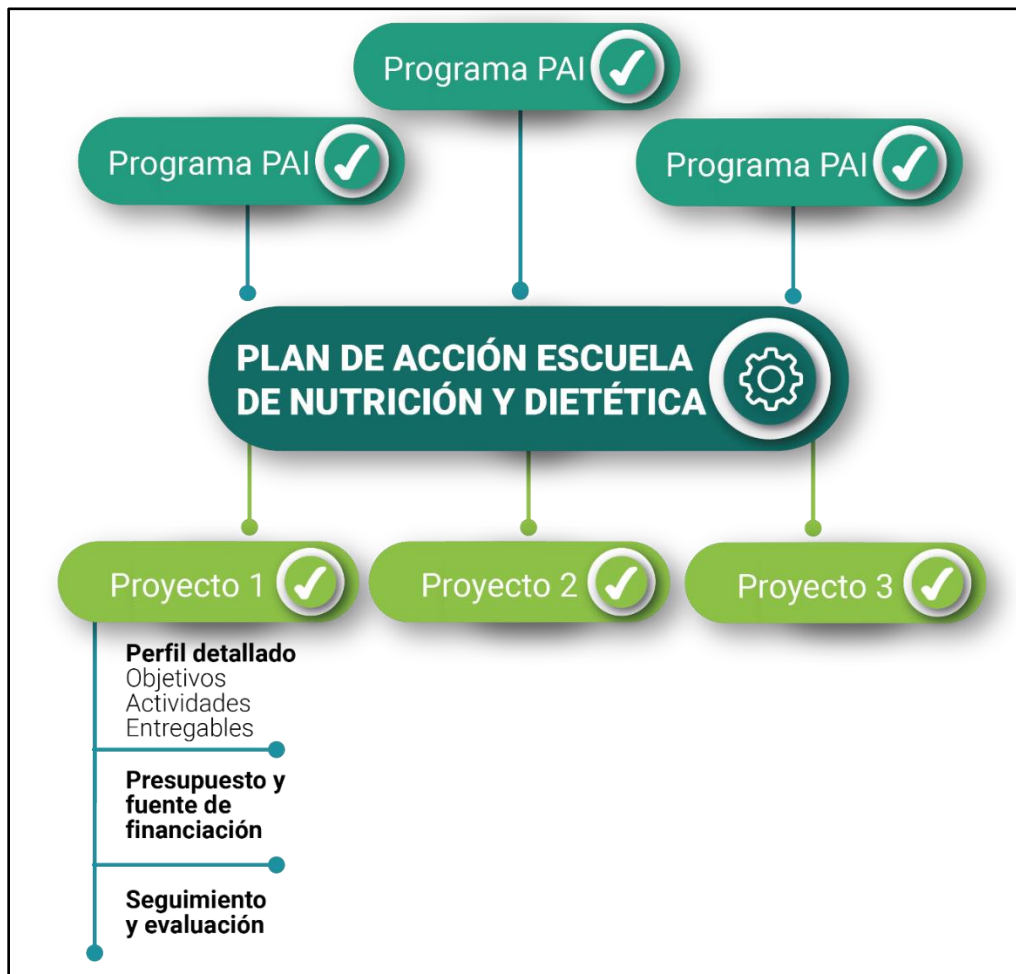
Gráfica 2. Estructura en cascada del Plan de Acción de la Unidad Académica

La estructura que constituirá el plan de acción se presenta a manera de cascada, tal como se muestra a continuación: