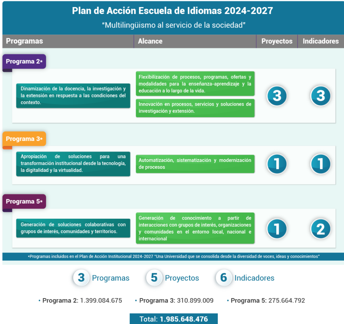
Figura 2. El Plan de Acción Institucional 2024-2027