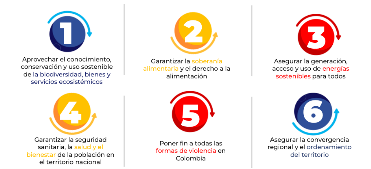
Imagen 2. Retos en los cuales se enmarcaron las demandas territoriales.