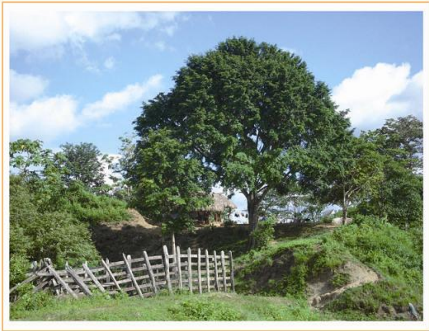
Zona rural región de Urabá