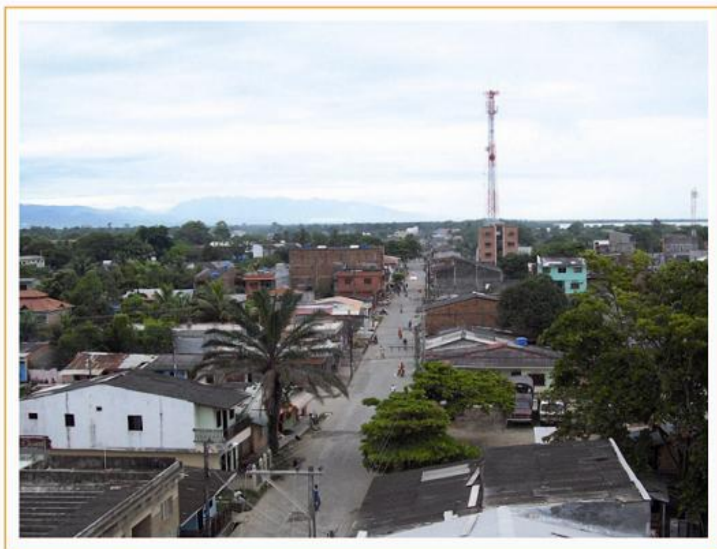
Panorámica Municipio de Turbo Distrito Especial Portuario