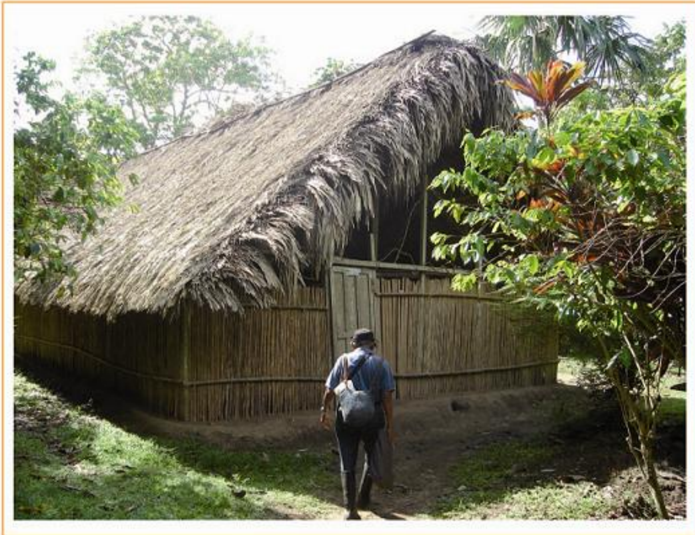
Comunidad indígena Tule