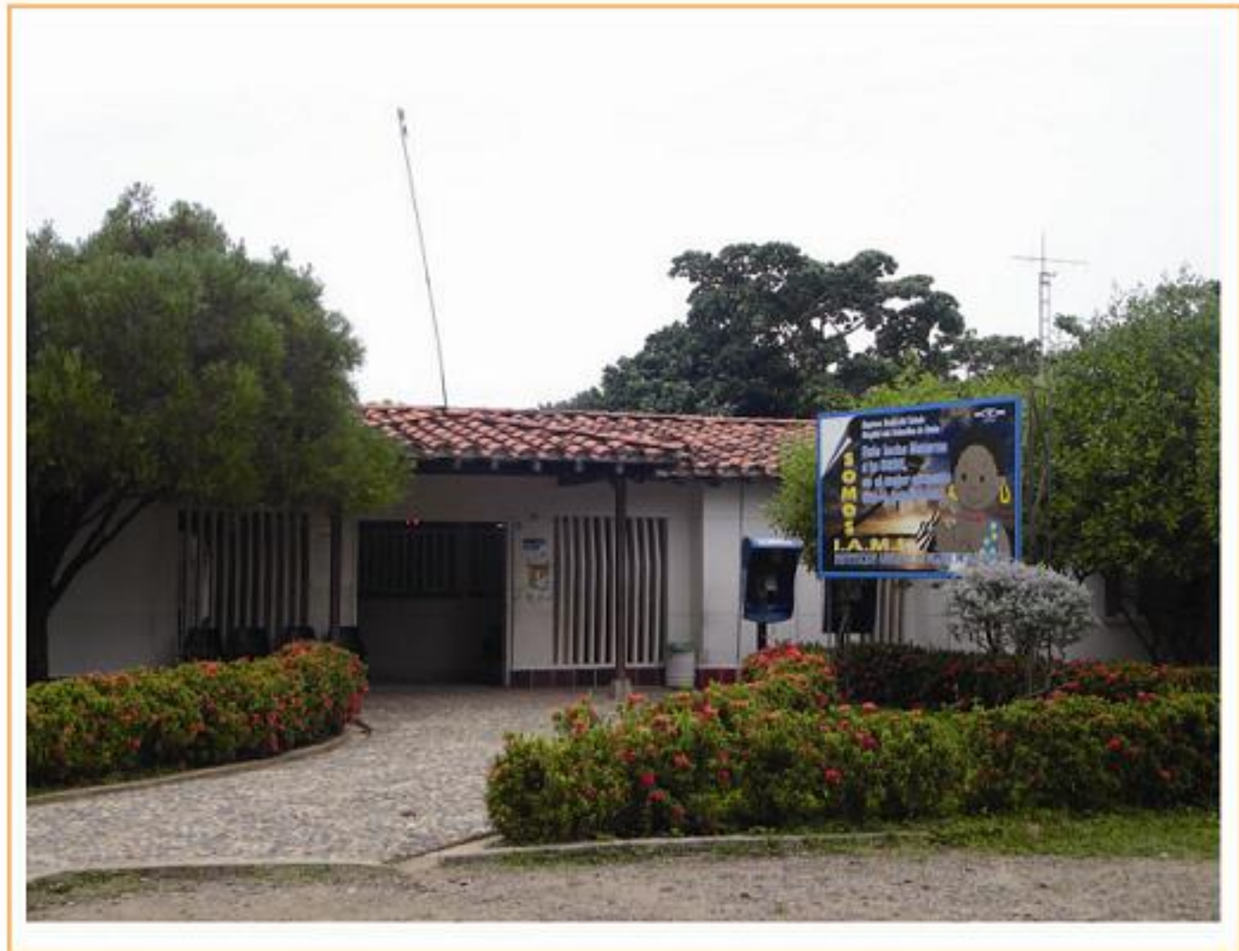
E.S.E. Hospital San Sebastián de Urabá, Municipio de Necoclí