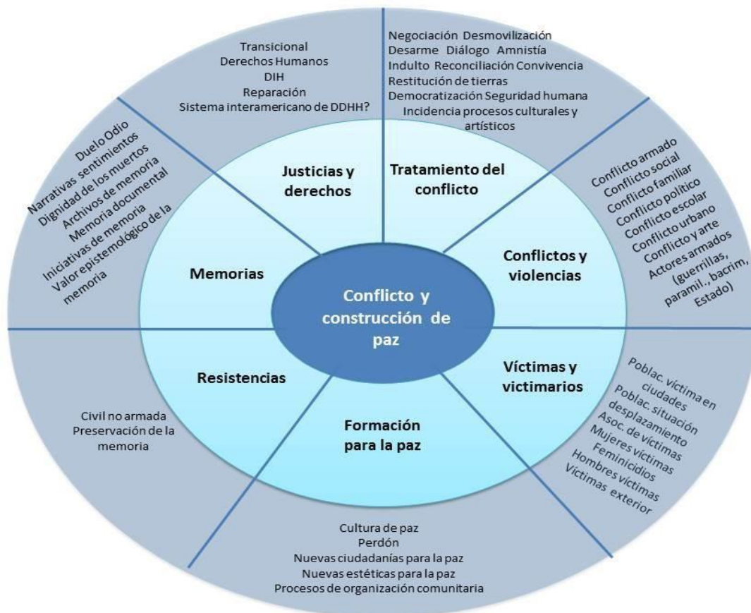
Gráfica 1. Inventario por ejes temáticos