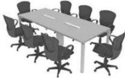
Ilustración 15. Imagen de referencia. M23