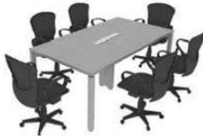
Ilustración 16. Imagen de referencia. M24